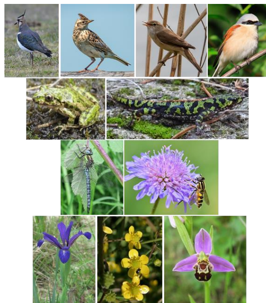
Figure 2 Les 11 espèces cibles choisies De haut en bas et de gauche à droite : Vanneau huppé ( Vanellus vanellus ), Alouette des champs ( Alauda arvensis ), Rousserolle effarvate ( Acrocephalus scirpaceus ), Pie-grièche écorcheur ( Lanius collurio ), Pélodyte ponctué ( Pelodytes punctatus ), Triton marbré ( Triturus marmoratus ), Aesche printanière ( Brachytron pratense ), pollinisateurs (ici un syrphé), Iris maritime ( Iris reichenbachiana ), Renoncule à feuilles d'ophioglosse ( Ranunculus ophioglossifolius ), orchidées (ici l'Ophrys abeille Ophrys apifera ).