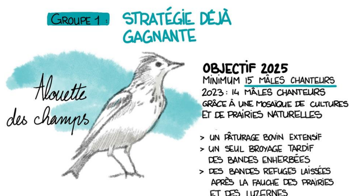
Figure 3 Illustration du groupe 1 avec le résultat de l'Alouette des champs

prairies de fauche ; un seul broyage annuel d'entretien des bandes enherbées entourant les surfaces cultivées à partir du mois de septembre, ce qui laisse une longue période (de mars à septembre) pour constituer des réservoirs en insectes pour l'alimentation des jeunes et des adultes ; absence de désherbage mécanique des céréales de printemps ; pâturage conforme à ce qui était prévu. Ainsi, en poursuivant avec cette même logique d'action, nous avons bon espoir d'atteindre nos objectifs pour cette espèce d'ici 2025.